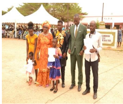
Les récipiendaires avec la Présidente d'honneur de Fondation SAF