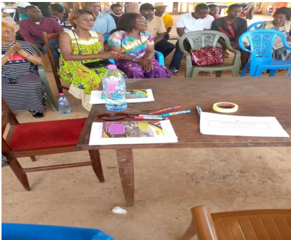
Animation Communautaire Fondation SAF