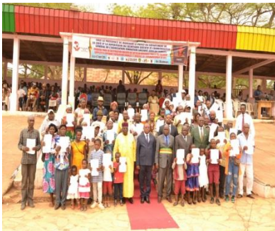
Photo de famille avec les Autorités administratives