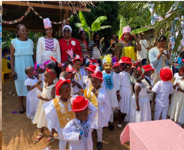
Remise du paquet minimum à l'école maternelle les papillons de Nkolzoa 1 Septembre 2023

Pour répondre aux besoins des populations sur le plan de l'eau et de l'énergie, Fondation SAF a construit un château d'eau pour le village de Nkolzoa 1 et ses environs avec des robinets de distribution d'eau dans chaque quartier du village. Cette réalisation a permis aux populations, non seulement de résoudre leur problème de distance avec les points d'eau non aménagés, mais aussi d'éradiquer nombre de maladies hydriques observées pendant de longues dates dans la localité.