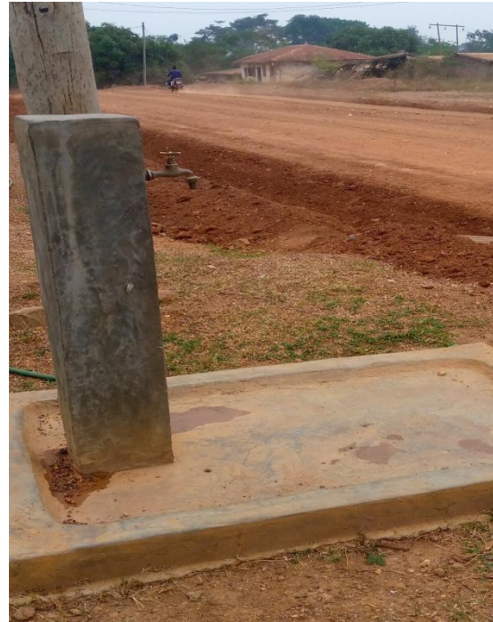
Château d'eau offert par Fondation au village Nkolzoa 1 Robinet de distribution à nkolzoa 1 chefferie