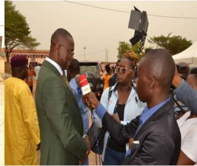
Point de presse du SE de Fondation SAF

Fondation SAF s'est également aussi, au cours de l'année 2023, intéressé à l'épanouissement de la jeunesse à travers l'animation communautaire dont les causeries éducatives, l'initiation à l'entrepreneuriat et l'organisation des championnats de vacances, l'appui à l'éducation à travers la remise des paquets minimums à certains établissements primaires et maternelles du groupement Kouna-Odjolo dans l'arrondissement de SA'A, des dons en matériels de santé au Centre de Santé Intégré de NkolMeyos.